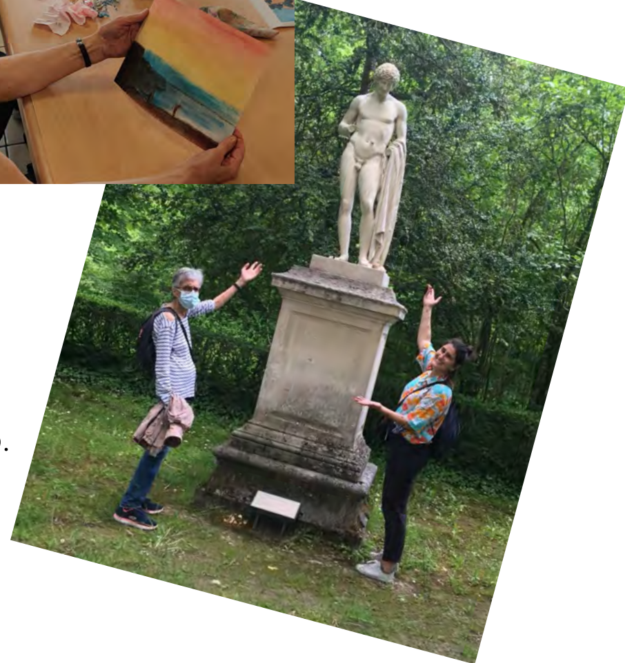
05 Reprise des visites. Ici visite du château de Compiègne