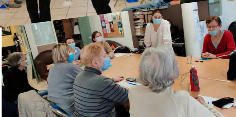
03 Atelier Solid'Up mené par les étudiants en médecine