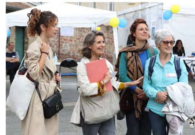
02 Quelques uns de nos partenaires venus partager cette journée avec nous.